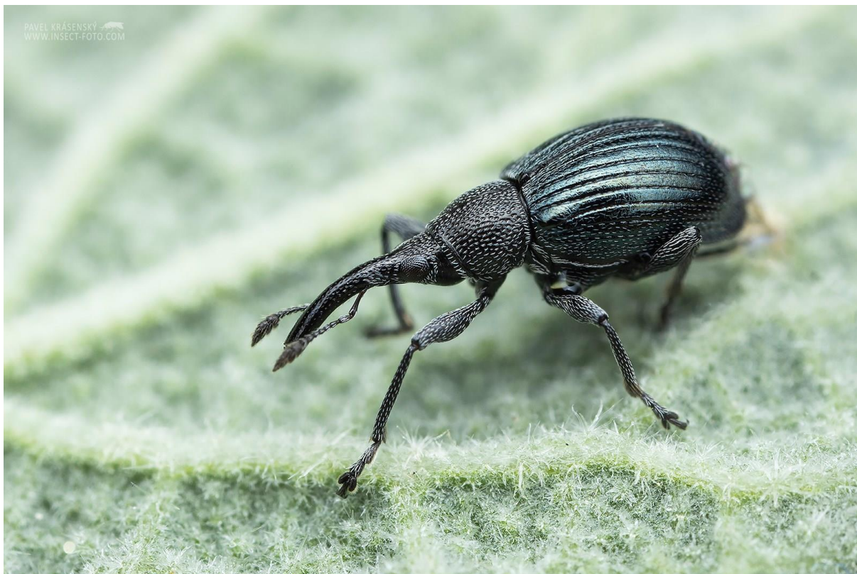
Vzácný nosatčík Aspidapion validum , objevený na topolovce v zahradě Oblastního muzea a galerie v Mostě roku 2019

Podává Oblastní muzeum a galerie v Mostě, příspěvková organizace Ústeckého kraje v roce 2020