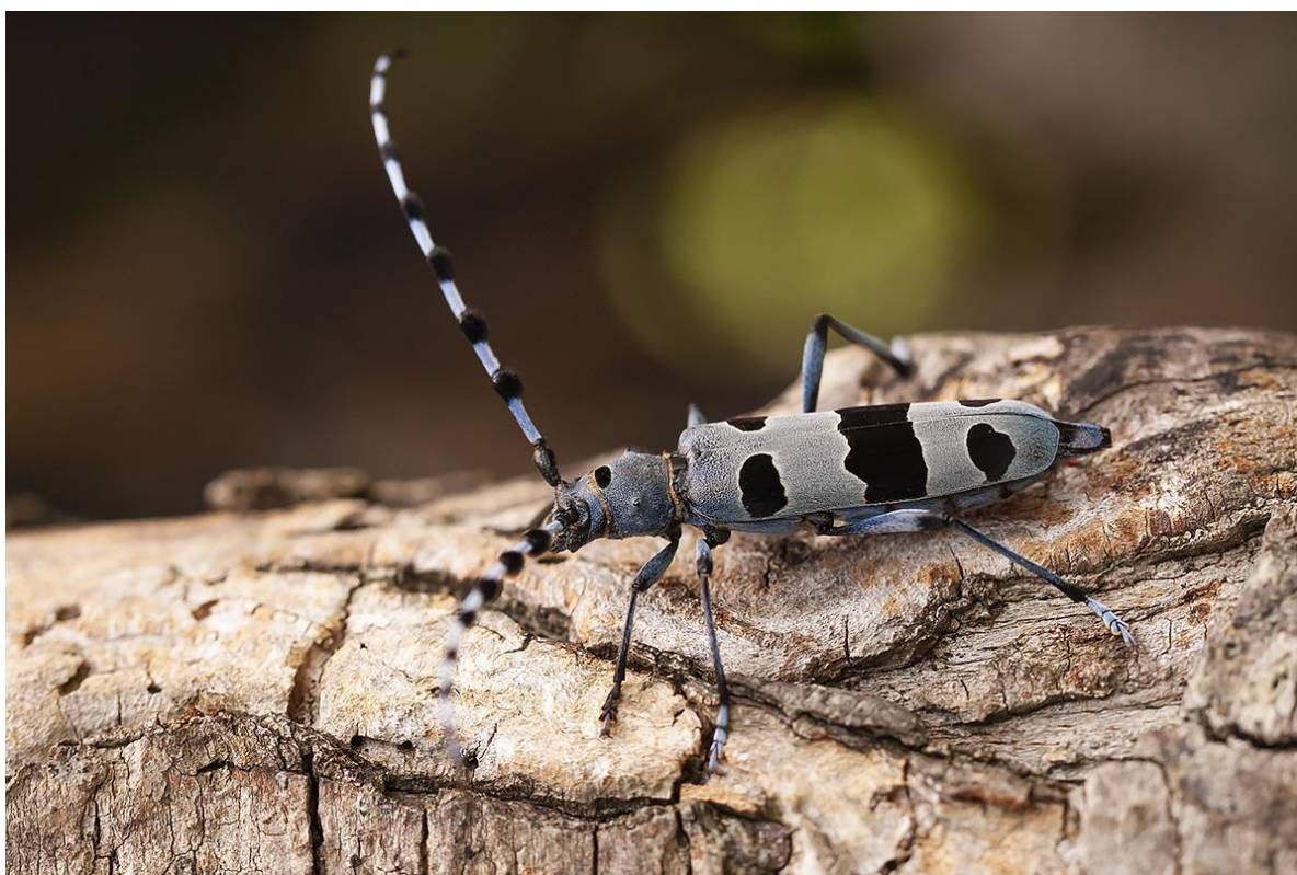
Tesařík alpský