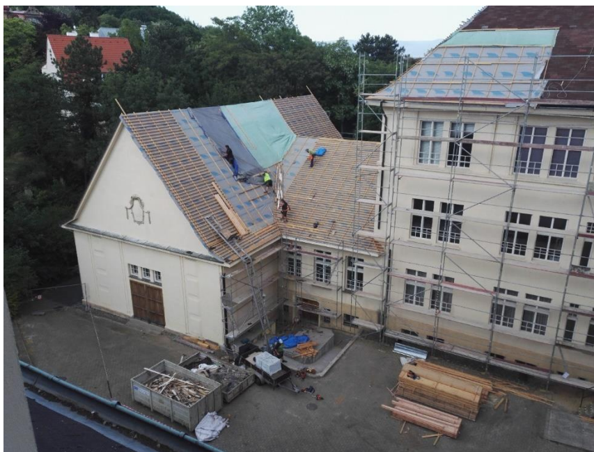
Oprava střechy OMM – snímek z května 2018

Od března pak byly zahájeny stavební práce – rekonstrukce střechy. Provozní oddělení bylo pověřeno zajištěním zázemí pro stavbu, průběžnou součinností včetně kontrolních dnů a kontrolou vlivu stavby na provoz muzea vč zajišťování nápravy (např. zatékání přes úseky s dočasně odstraněnou krytinou apod.).