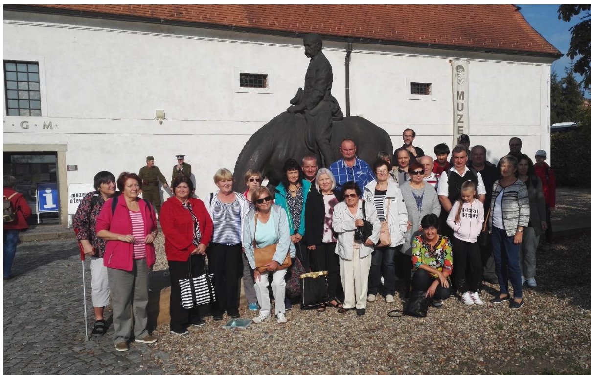
Muzeum TGM v Lánech - účastníci exkurze Oblastního muzea v Mostě, uspořádané v rámci oslav 100. výročí vzniku Československé republiky

Zpracovalo Oblastní muzeum v Mostě, příspěvková organizace Ústeckého kraje v roce 2019