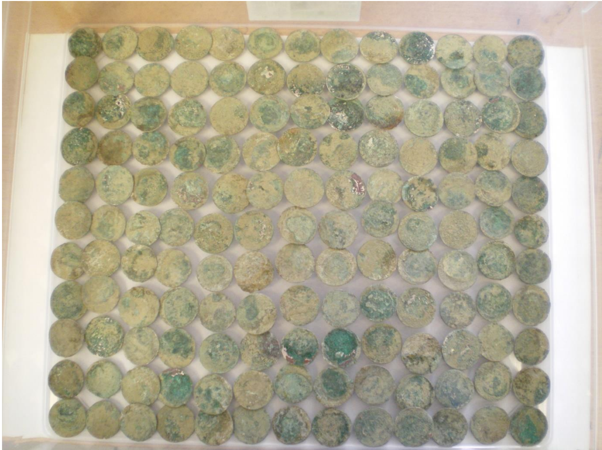
Část mincí z Koporečského pokladu před zahájením konzervace

Velice náročným úkolem byla úplná konzervace 251 kusů stříbrných mincí (včetně zpracování podrobné zprávy o stavu před a po konzervaci) z archeologického nálezu v Koporči (2018), které byly nálezci odevzdány do OMM. Soubor je zařazen do muzejní sbírky a v nejbližší době by měl být publikován.