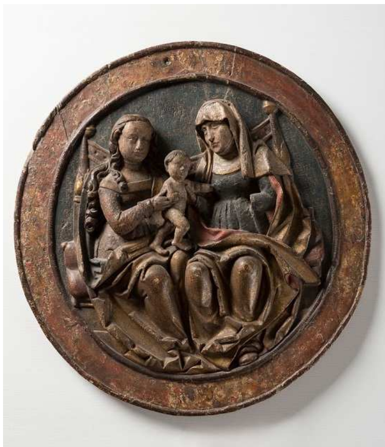
Kruhový reliéf se sv. Annou Samotřetí z výzdoby svorníku klenby severní předsíně děkanského kostela Nanebevzetí Panny Marie v Mostě (před 1530), snímek před restaurováním. Foto Miloš Žihla 2018, © Ústecký kraj.

OMGM se fenoménu Krušných hor dlouhodobě věnuje především z etnografického hlediska a sehrálo podstatnou roli při budování Krušnohorského muzea Lesná, a to nejen výpůjčkami, ale hlavně odbornou pomocí. Hornický region Krušnohoří rovněž trvale propaguje svými aktivitami. V průběhu roku 2017 podpořilo OMGM nominaci před jejím předáním Výboru světového dědictví, když v muzeích Ústeckého kraje organizovalo v roli koordinátora putovní výstavu firmy FORNICA graphics, s. r. o. Horní města Krušných hor . Výstava v česko-německé mutaci navázala na vydání dvou stejnojmenných knih pro Karlovarský a Ústecký kraj