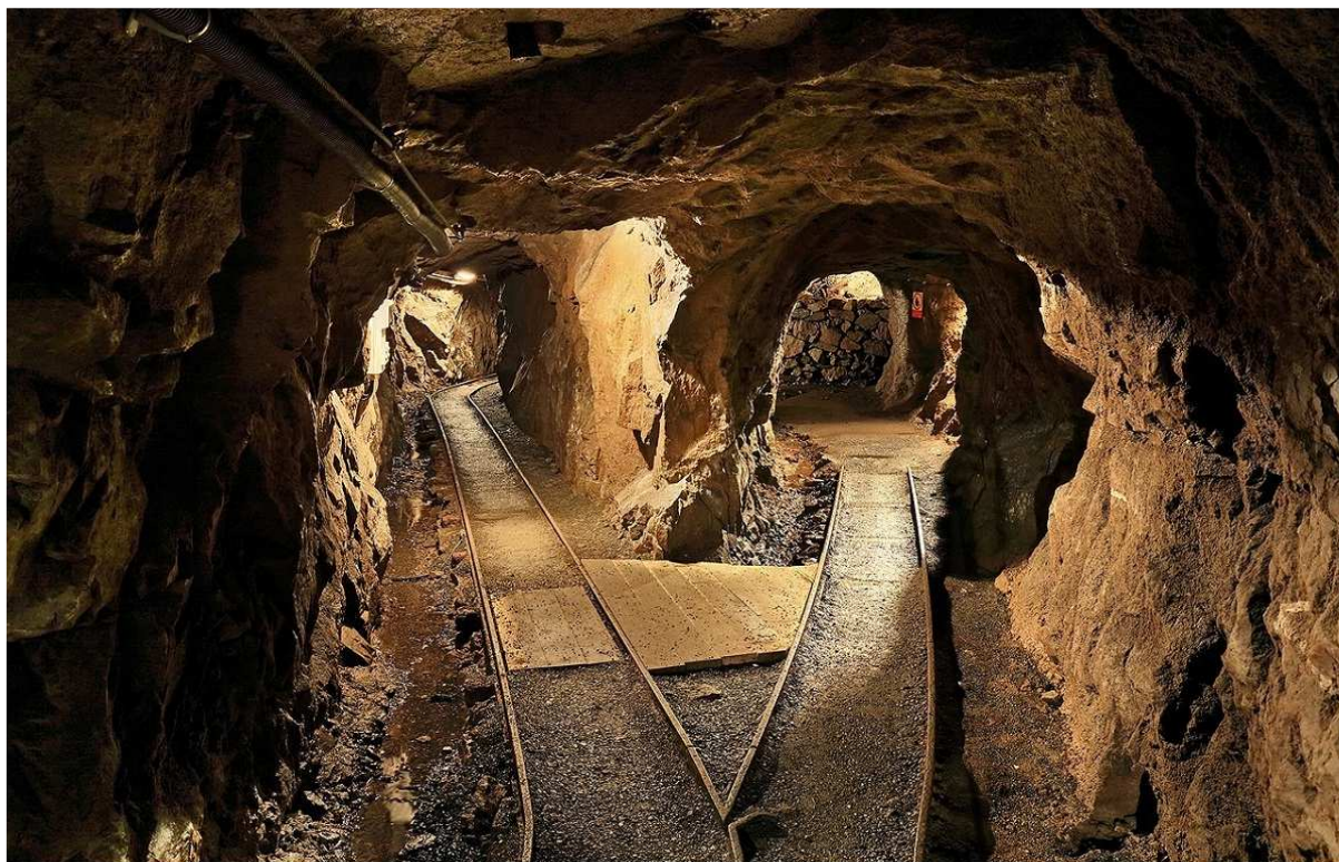
Krupka, podzemí štoly Starý Martín.

české pracovní skupiny ve věci potenciálu české části Krušných hor byly předloženy v roce 2006, a to v závěrečné zprávě shrnující posouzení české části Krušnohoří jako hornické a kulturní krajiny s vytipováním objektů vhodných pro zápis na Seznam světového dědictví UNESCO.