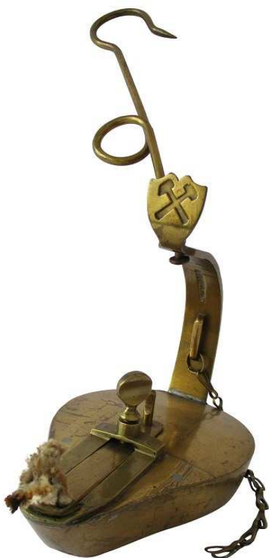
Hornický kahan ze sbírky Věda, technika a průmyslová výroba OMGM.

Jednotlivé součásti série dokládají široký vliv, který měla zdejší těžba a zpracování rud na rozvoj hornictví a hutnictví po celém světě. Ve své jednotě převyprávějí dlouhý příběh unikátní hornické krajiny, proměňující se v závislosti na intenzitě těžby. Výjimečný globální význam sériového statku, respektive jeho zdůvodnění vyjadřuje prohlášení mimořádné univerzální hodnoty (Statement of Outstanding Universal Value) , v podstatě jeho rodný list. Tento je volně přístupný na webových stránkách Centra světového dědictví ( http://whc.unesco.org/en/list/1478 ), kde se mohou zájemci seznámit s veškerou dokumentací, včetně nominační složky, jež sloužila k zápisu na Seznam světového kulturního a přírodního dědictví UNESCO.