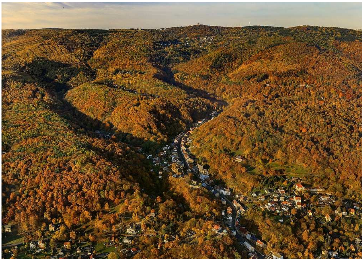
Hornická krajina Krupka, letecký pohled od jihu.

(viz http://mukrupka.cz/hornicka-krajina-krupka/ms-1649/p1=1649 )