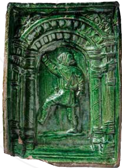
Figura horníka v nice , první čtvrtina 16. století, pálená hlína, glazováno, Regionální muzeum v Teplicích

Výstava pořádaná Ústeckým krajem ve spolupráci s Oblastním muzeem v Chomutově, starobylá radnice, náměstí 1. máje 1, Chomutov, výstavní sál, ve dnech 5. února 2021 až 18. dubna 2021. Výstava je stěžejním výstupem česko-německého přeshraničního projektu Umění pozdního středověku v hornické oblasti Krušnohoří , r. č. 100289027, financovaného z Programu na podporu přeshraniční spolupráce mezi Českou republikou a Svobodným státem Sasko 2014–2020.