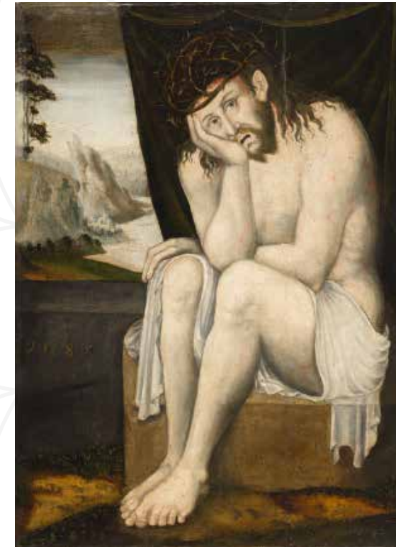
Mistr I. W. – kopista, Odpočívající Kristus , datováno 1585, olejová tempera na dřevě, Oblastní muzeum v Chomutově