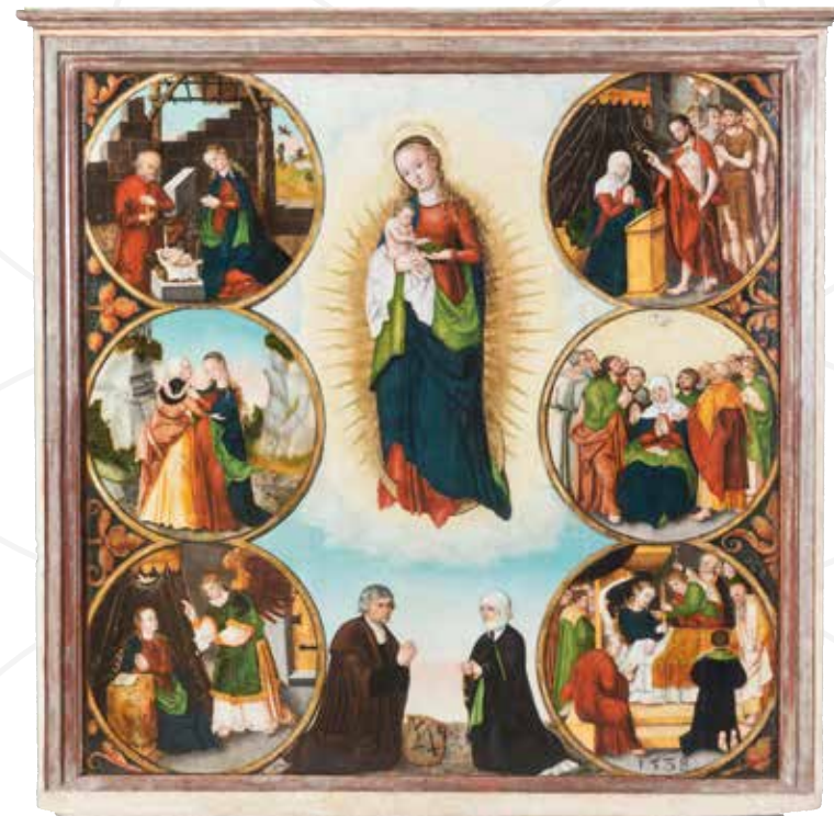
Mistr I. W., Votivní deska mostecká , datováno 1538, olej na smrkovém dřevě, Oblastní muzeum a galerie v Mostě

Otevírací doba: Út–Pá 9–17 hod., So 13–17 hod. Výstava je zpřístupněna virtuální prohlídkou. Text © Jitka Šrejberová, 2021 Typo © Marek Jodas, 2021 © Ústecký kraj, 2021 www.kr-ustecky.cz ; www.muzeumchomutov.cz ; www.muzeummost.cz