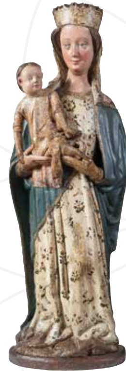
Madona z Krupky II. , 1450–1460, topolové dřevo, polychromováno, Regionální muzeum v Teplicích