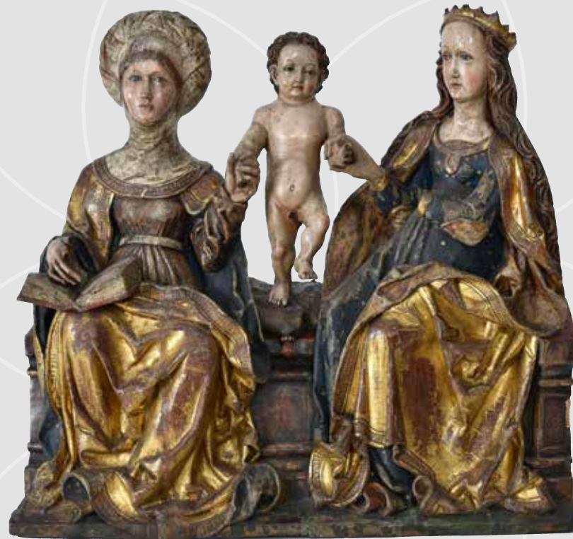
Sv. Anna Samotřetí z ústeckého muzea , druhé desetiletí 16. století, dřevo, polychromováno, Muzeum města Ústí nad Labem