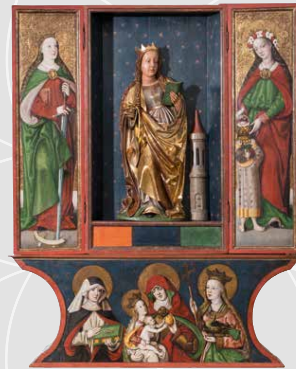
Hans Hesse (malby) a sochař francko-švábského školení, retábl se sv. Barborou , malby před 1513, tempera na smrkovém dřevě, zlacení, socha 1500–1510, lipové dřevo, polychromováno, Oblastní muzeum v Chomutově